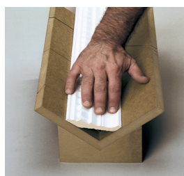
3-5. Skær de udvendige eller indvendige vinkler.