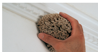
10. ....og aftør straks med en fugtig svamp.