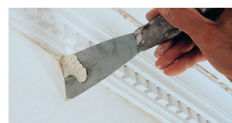
9. Fjern den overskydende klæber med en spartel...