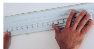
7. Placér listen langs den markerede linie på væggen og tryk let for at fjerne den overskydende klæber.