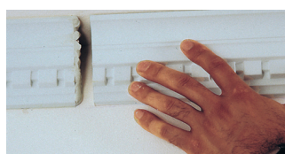
8. Udfyld eventuelle fuger med klæberen.