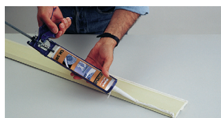
6. Kontrollér at målene er korrekte. Påfør rigeligt med klæber på listens to klæbeflader samt på listens ene ende.