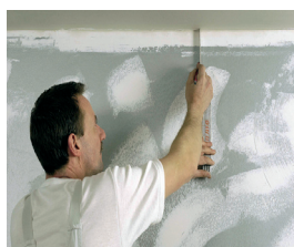
1. Mål og markér hvor stuklisten afslutter.

Brug altid det rigtige værktøj når der opsættes lister og rosetter: Skærekasse, sav, kniv, spartel, målebånd, svamp og blyant.